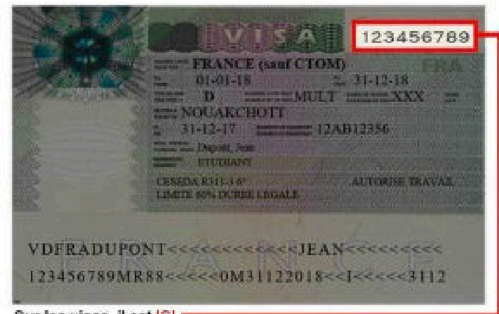
Sur les visas, il est ICI