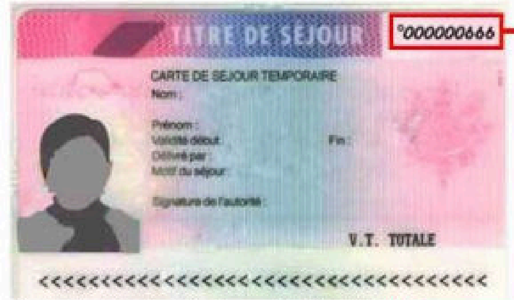
Sur les titres de séjour délivrés avant juin 2011, il est ICI