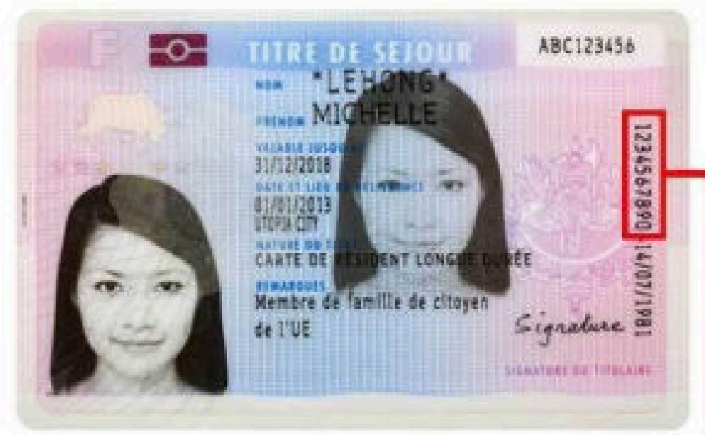
Sur les titres de séjour délivrés avant octobre 2020, il est ICI