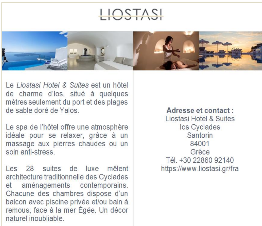
Document 2 :